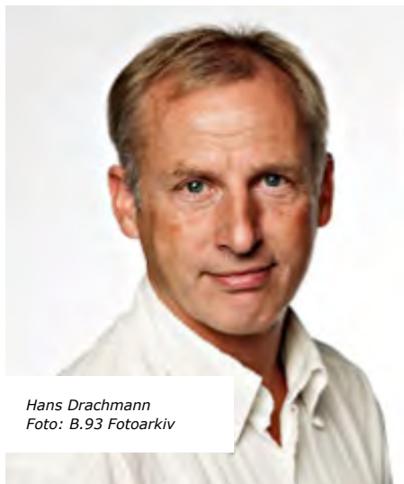
Hans Drachmann

Jens vil for de fleste først og fremmest være kendt som en eminent spiller, en ren driblekunstner med nogle fremragende afleveringer og afslutninger. En rigtig publikumsspiller, som har skabt stor respekt om sig selv, men også om klubben. Jens repræ-