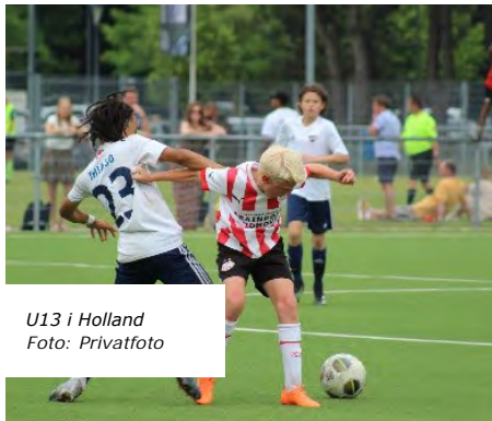
U13 i Holland

Selvom holdet igennem sæsonen i Liga 1 har haft udfordringer, viste de her deres sande potentiale i kampene mod nogle af Europas største fodboldhold.