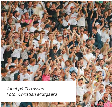
Jubel på Terrassen

Det blev en kamp, ingen af de medrejste vil glemme. Med fare for at tage for store ord i munden tror jeg, at den kamp vil blive en klassiker i nyere 93-klubhistorie.