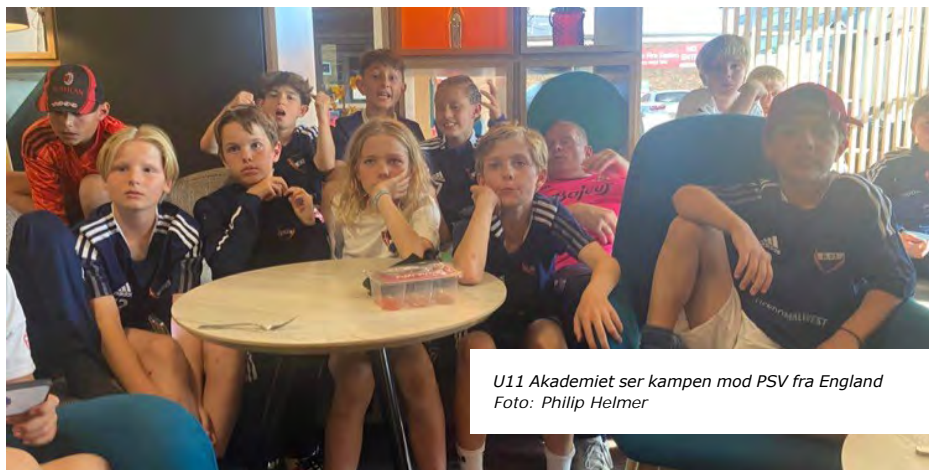
U11 Akademiet ser kampen mod PSV fra England

Bosch, som blev sidst i deres gruppespil. De var ikke så stærk en modstander, og drengene slog dem 2-0.