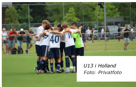
U13 i Holland

deres flotte resultat som nummer 16 ud af 40 hold i turneringen styrket både holdet, venskaber og sikret oplevelser for livet. Det bliver spændende at følge holdet i næste sæson.