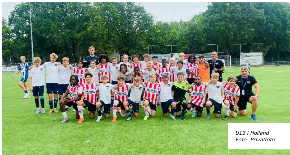
U13 i Holland

B.93's U13-drenge (nu U14) afsluttede sæsonen med en mindeværdig rejse til Holland, hvor de med støtte fra BackOp Foreningen deltog i den prestigefyldte TSC International Tournament.