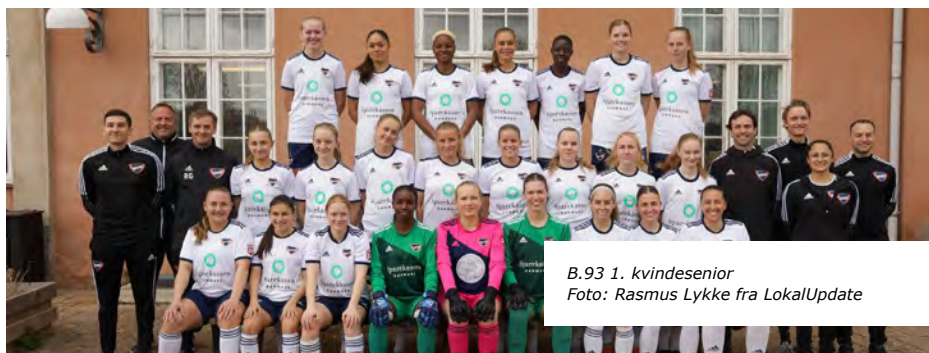
B.93 1. kvindesenior

Københavnkonkurrenterne fra Sundby havde sidste år snydt os for oprykning, men røg hurtigt retur fra Kvindeligaen. Og i december trak investorerne sig fra klubben fra Kløvermarken. Det betød, at flere af de spillere, som amagerkanerne med deres – engang – store tegnebog havde lokket fra København Ø til S, nu forlod klubben for at vende tilbage til B.93. Den finske forsvarsdirigent Freja Lähteenmäki samt midtbanespillerne Josefine Funch,