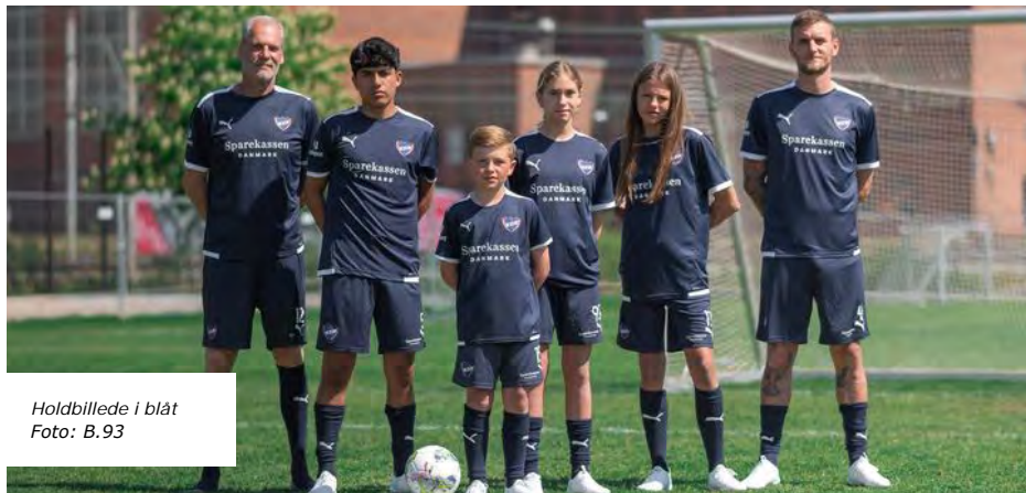
Holdbillede i blåt