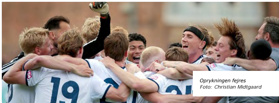
Oprykningen fejres