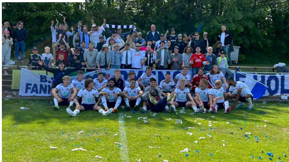
Sejren i Aarhus fejres

7.200 tilskuere forsøgte at blæse deres helte frem mod sejr. Og det var da også et regulært stormvejr, B.93 røg ud i det vestjyske. Angreb på angreb skyllede ned mod 93-målet. Men målmand Vaporakis, der havde tilbageerobret sin plads mellem stængerne i løbet af foråret, valgte meget passende at stå sit livs kamp. Og hvad han ikke nappede, fik Esbjerg-angriberne på ubegribelig vis sendt forbi mål.