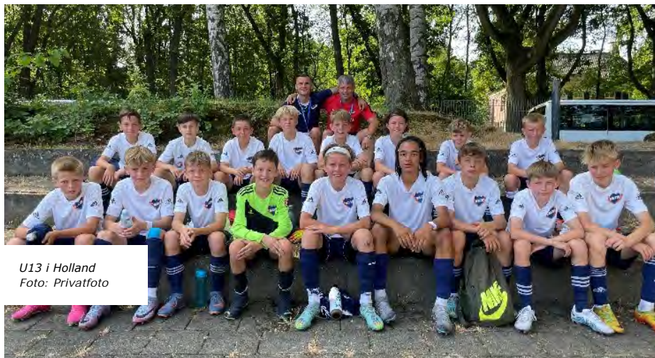
U13 i Holland