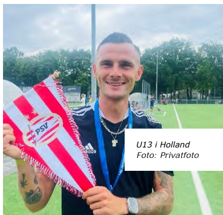
U13 i Holland

Selvom U13-drengene ikke gik hele vejen i TSC International Tournament, har