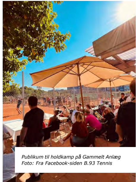
Publikum til holdkamp på Gammelt Anlæg

et kapitel for sig. I det næste nummer af Medlemsbladet, der udkommer til november, bringer vi en fyldig gennemgang af hele udendørssæsonen for vores elitehold.