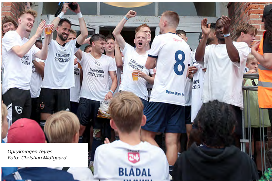
Oprykningen fejres

Med sejren over AB fik B.93 slået et hul ned til akademikerne, og det skulle snart vise sig, at Gladsaxe-holdet ikke helt kunne holde trit med de øvrige fire tophold og lige så stille blev skivet af i oprykningsskampen.