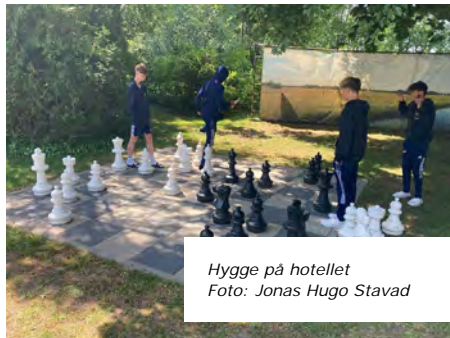
Hygge på hotellet

Drengene startede kampen med flot spil og flere chancer, men ved pausen stod det stadig 0-0. Drengene fortsatte dog det flotte spil i anden halvleg, hvilket udmøntede sig i en scoring. Desværre