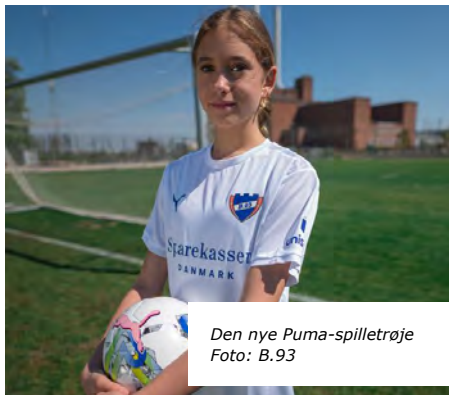
Den nye Puma-spilletøj

God fornøjelse til alle medlemmer med Puma og Unisport.