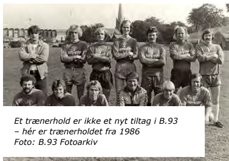
Et trænerhold er ikke et nyt tiltag i B.93 – hér er trænerholdet fra 1986