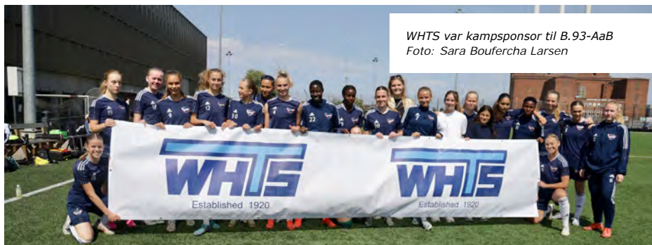
WHTS var kampsponsor til B.93-AaB

I topkampen mod AGF sikrede aarhusianerne sig oprykning med en 2-1-sejr. B.93 var ellers tæt på at kæmpe sig tilbage efter en 2-0-føring til AGF ved pausen. Men det blev ved lige ved og næsten, og de hvi'e fra Fredensvang sikrede sig med sejren oprykning til Kvindeligaen.