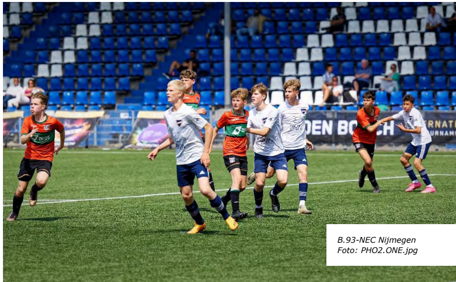
B.93-NEC Nijmegen

Med økonomisk støtte fra BackOp Foreningen blev U14 Akademiets kurs sat mod den hollandske by 's-Hertogenbosch i den sidste weekend i maj. Med udsigt til at spille mod nogle af de helt store europæiske klubber inden for drengenes årgang drog 18 håbefulde B93-dreng af sted til Den Bosch International Tournament.